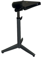
Buse d'aspiration réglable