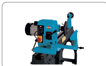
Rotation de la tête jusqu'à 180°