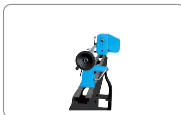
Poupée fixe et mobile percée à 10 mm