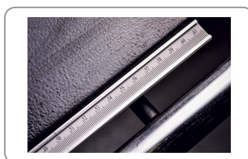
Guide de refente avec réglage micrométrique