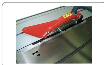
Chariot ras de lame de 2000 mm