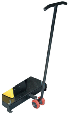
Kit de déplacement