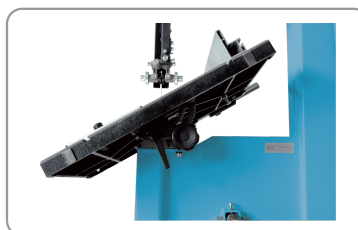
Table inclinable à 45°