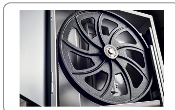
Volants en fonte dacier équilibrés