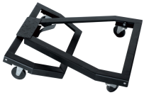
Kit de déplacement