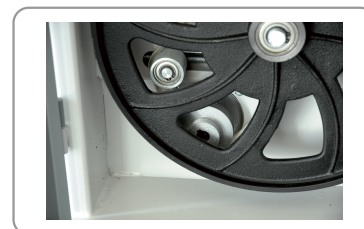
2 vitesses de coupe, pour bois et métaux non-ferreux