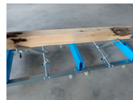
Système de maintien de grume