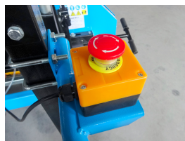
Bouton d'arrêt d'urgence