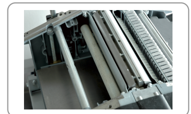
Rouleaux entraînement pour l'avance de la pièce de bois