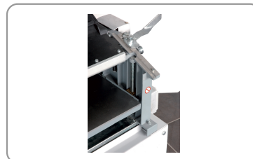
Table de rabotage en fonte d'acier sur 4 vérins filetés