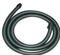
Flexible à baïonnette 4 m, Ø 38-32 mm