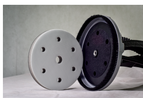
Fixation du disque sur pad double face auto-agrippant