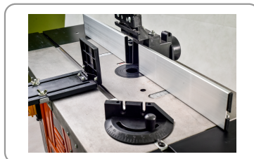
Table en fonte d'acier