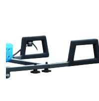
Poignées avec revêtement grip