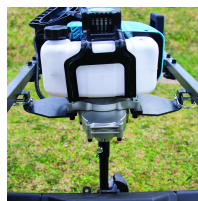
Montage du bloc moteur sur pivots