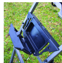
Boîtier de rangement des accessoires