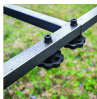
Châssis démontable sans outil