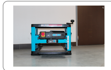
Table de rabotage en acier galvanisé