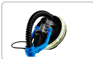
Eclairage led sur la tête de ponçage.