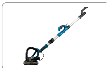
Livré avec une mallette de rangement