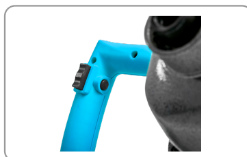
Bouton de déverrouillage