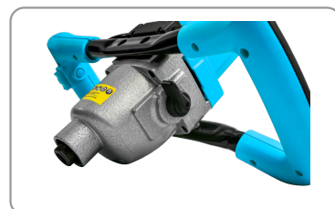
2 modes de vitesse : lent / rapide