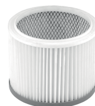
Filtre cartouche lavable HEPA