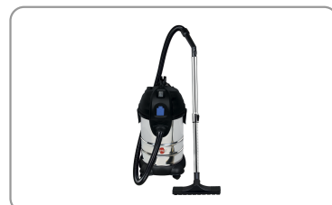
Prise de synchronisation pour machine électroportative maxi 1800w