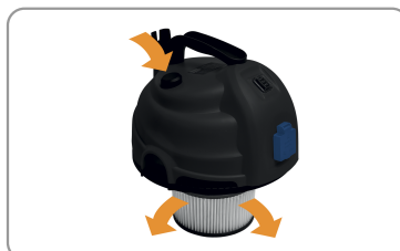
Décolmatage manuel du filtre