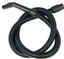
Tuyau flexible 1,5 m