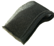
Filtre en mousse pour liquides