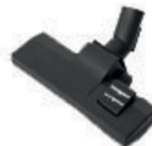
Suceur pvc poussières et liquides