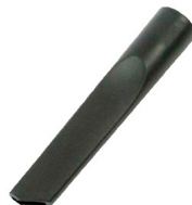
Suceur plat droit