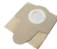
Sac filtre en papier 30 L (lot de 5 pièces)