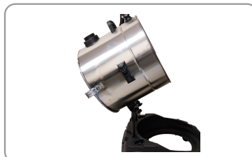
Cuve basculante pour l'évacuation des déchets