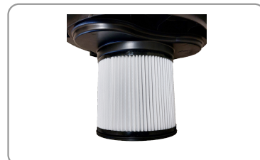
Filtre plissé hepa