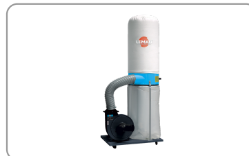
Sac de filtration en feutre