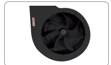
Hélice en acier