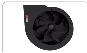
Hélice en acier