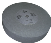
Meule corindon Ø 250 mm grain 220