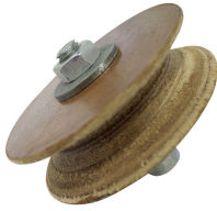
Disque de démorfilage pour gouges