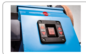
Interrupteur marche/arrêt avec sélection du sens de rotation