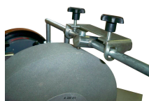
Redresse meule diamanté