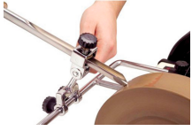
Dispositif d'affûtage pour gouges