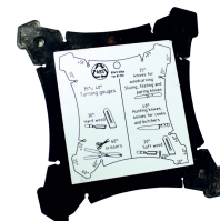
Gabarit pour mesure des angles