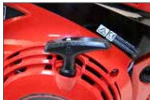
Lanceur étanche, empêche les ressorts et la corde de lanceur de casser