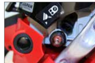
Pompe d'amorçage, démarrage rapide, corde de lanceur préservée