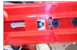
Tendeur de courroie facilement accessible