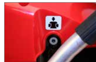
Valve de décompression