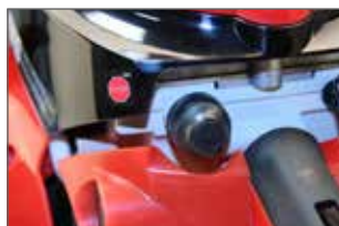
Bouton d'arrêt moteur, redémarrage rapide et facile du moteur