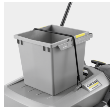
Système Home Base