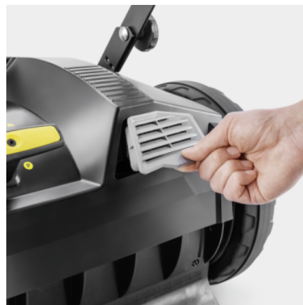
Filtre pour poussières