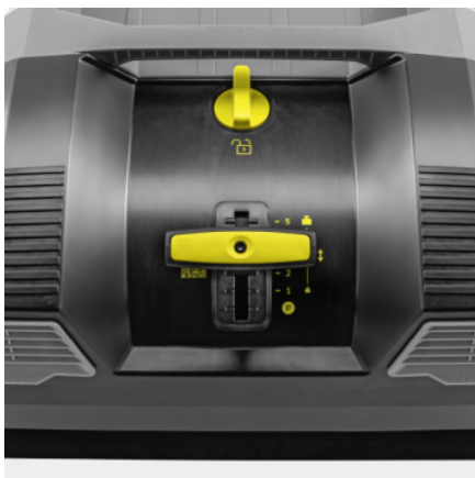
Brosse principale et brosses latéraux toujours réglables