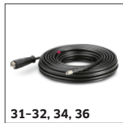
31-32, 34, 36