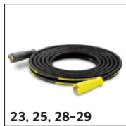
23, 25, 28-29