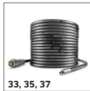
33, 35, 37